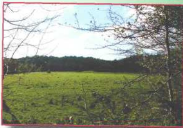
Dowris, Irland The Heritage Council