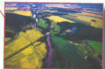
Prácheňsko, Tscheschische Re- publik Archeologický ústav AVCR Praha