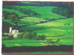
Bowland, England English Heritage Lan- cashire County Council