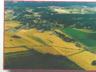
Untamala, Finnland Museovirasto