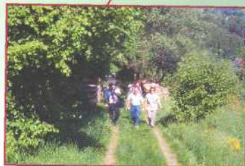
Spessart, Deutschland Archäologisches Spessart-Projekt