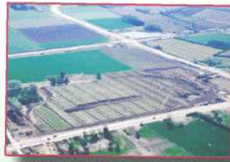
Fünen, Dänemark Odense Bys Museer