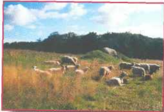
Albersdorf, Deutschland Archäologisch-Ökologi- sches Zentrum Albersdorf