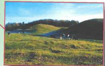
Bjäre, Schweden Föreningen Bronstid