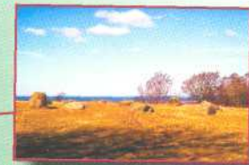
Halland, Schweden Stiftelsen hallands Läns museer Landsantikvarien Hallands kommun