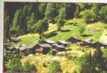
Paneveggio, Italien Ente Parco Paneveggio - Pale die San Martino