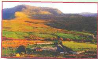
Arfon, Wales Gwynedd Archaeological Trust