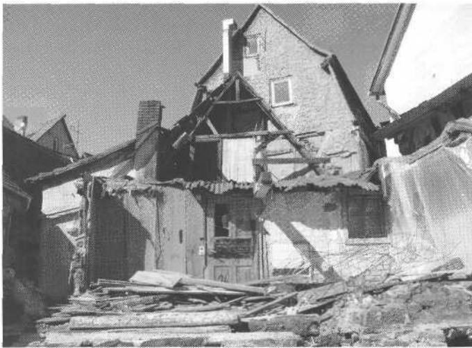
4 Abriss eines Spessarthauses. Die einfachen, aber typischen Häuser der Spessardtöfer werden meist eher als Zeugnisse der Armut der Vergangenheit denn als historische Denkmale gesehen.

bedeckten Hügeln zwei ganz unterschiedliche Prozesse ab. In den Tälern entfalteten sich die Güter der Großgrundbesitzer, meist englischer Adliger, die besonders seit dem 18. Jahrhundert die Landschaft ganz nach ihrem Geschmack umformten. So ließ etwa die Oakeley-Familie ihr Herrenhaus Plas Tan y Bwlch am Abhang des River Dwyryd erbauen und den Hang in eine Parklandschaft umgestalten. Der Gegenhang wurde mit Wald bepflanzt, der ursprünglich gerade durch das Tal fließende Fluss in künstliche, malerische Mäander gelegt (ein faszinierendes Gegenstück zu späteren, wirtschaftlich motivierten Flussbegradigungen) und das Dorf für die Angestellten, Farmhelfer und Waldarbeiter am Talschluss vom selben Architekten des Herrenhauses angelegt, so dass es aus der Hauptsichtachse unsichtbar blieb, aber von bestimmten Stellen des Hauses und der Terrasse aus eingesehen werden konnte. Ein ganzes Tal wurde so komplett umgestaltet und eine szenische, ornamentale Landschaft geschaffen, die ganz den Bedürfnissen und Wünschen