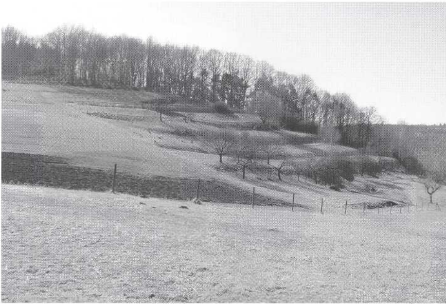
1 Heute nicht mehr bewirtschaftete Ackerbauterrassen im Flörsbachtal, Spessart. Wenn die Bäume belaubt sind, ist von den einstigen Terrassen kaum noch etwas zu sehen.

seine Beziehung zu seiner Umwelt, die Interaktion von Mensch und Umwelt, das Zusammenspiel von Kultur und Natur, und besonders die Art und Weise, wie der Mensch diese Prozesse wahrnimmt, interpretiert und darstellt. Darin liegt der entscheidende Unterschied zum Begriff Umwelt, die auch ohne den Menschen existieren kann. Aber erst durch den Menschen wird die Umwelt zur Landschaft, und jede Diskussion über Landschaft, die nicht beim Menschen beginnt und den Menschen in den Mittelpunkt der Betrachtung stellt, geht am Thema vorbei.