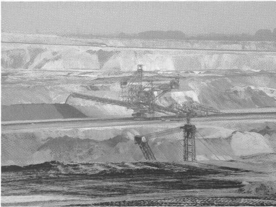
3 Kohlebagger im Rheinischen Braunkohlerevier.