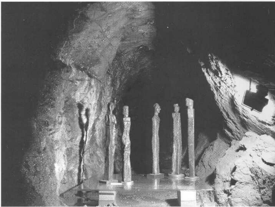
7 Ausstellung zeitgenössischer Plastik in der Grube Wilhelmine, einem ehemaligen Kupferbergwerk im Spessart.

Denn man kann sich natürlich nicht nur mit den materiellen Aspekten der Landschaft beschäftigen, sondern wie eingangs schon erwähnt stellt auch die geistige Auseinandersetzung des Menschen mit seiner Umwelt und sein Verhältnis zur Landschaft einen wesentlichen Bestandteil eben dieser Landschaft dar, wird Umwelt erst durch die Betrachtung durch den Menschen zur Landschaft. Es hat vielleicht gerade deshalb in jenen Staaten Europas, in denen die Theoriediskussion in der Archäologie älter ist und stärker anthropologisch geprägt als in Deutschland, auch die Beschäftigung von Archäologen mit der Landschaft schon früher eingesetzt. Aber es ist gerade der holistische Aspekt der Landschaftsforschung, bis hin zu dem Zwang zu interdisziplinärer Forschung mit einem echten und dauerhaften Dialog zwischen zahlreichen geistes- und naturwissenschaftlichen Fächern, der die Landschaftsforschung für Archäologen interessant machen müsste. Schließlich hat schon der Stammvater der deutschen Archäologie, Rudolf Virchow (1821-1902, selbst Arzt, Naturwissenschaftler und Anthropologe) den umfassenden Charakter der Archäologie hervorgehoben, die er eine Mischung aller Geistes- und Naturwissenschaften nannte, die sich irgendwie mit dem Menschen beschäftigen - die klassische Humanwissenschaft also (Bosinski 1985).