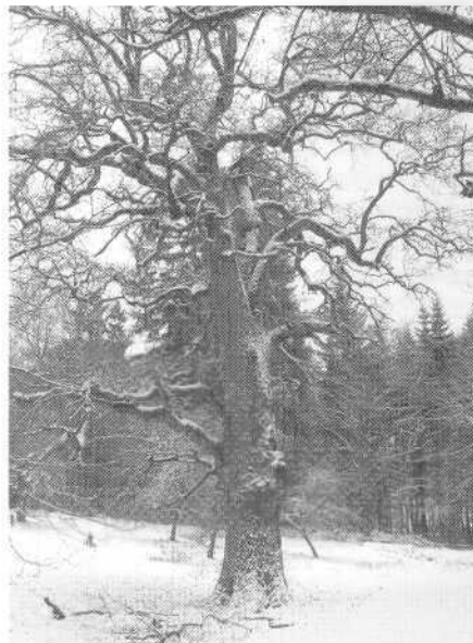
8 Typische Wuchsmerkmale an Bäumen, hervorgerufen durch ehemalige Nutzungen wie Laubheugewinnung oder Waldweide, erzählen die Geschichte der Kulturlandschaft.

Es ist hier nicht der Ort auf die einzelnen Forschungsprojekte innerhalb unseres europäischen Partnerprojekts Pathways to Cultural Landscapes einzugehen. Aber die Bandbreite der Methoden, die