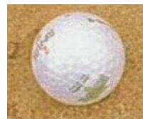
Par 3 boll. Torekov.