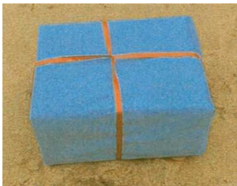
Golfpaket. S.k. helhetslösning. Arkeologerna är än idag konfunderade över hur övermattning med green-fee kunde rymmas i paketet.